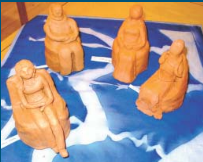
Korkalovaaran 8. luokan saviveistostutkielmaa olemisesta

Samaan mielipiteeseen oli helppo yhtyä. Arktikumien rasti oli mieleenpainuva. Mieleen jäivät edellä mainittujen töiden lisäksi hauskat alaasteen eläinpiirrokset, upeat maisema- ja kohdemaalaukset sekä taidokkaat yksilötyöt, joista tämän artikkelin yhteydessä voimme harmillisesti julkaista vain murto-osan. Toisaalta niitä oli ihailemassa ihmisiä kaikkialta maapallolatamme.