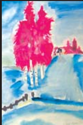
Suvi Pasma 8. lk Muuroalan yläaste