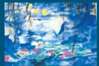
8. lk (nimi työssä kastunut) Muuroalan yläaste