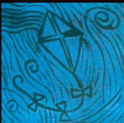
"Tuulen viemä" Ansku Määttä 7.Ik