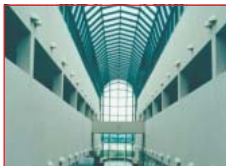
Tiedekeskus ja museo Arktikum