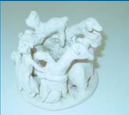
Anitta Yritys, Muurolan yläaste

taessa. Myös yksilölliset erikois- teokset ja keramiikka houkuttivat. Näyttelytilassa vierailleet kävijät ikään kuin olisivat olleet toisissa maailmoissa nuuskiessaan esillä olleita mielenkiintoisia ja yksityiskohtaisestikin rikkaita töitä.