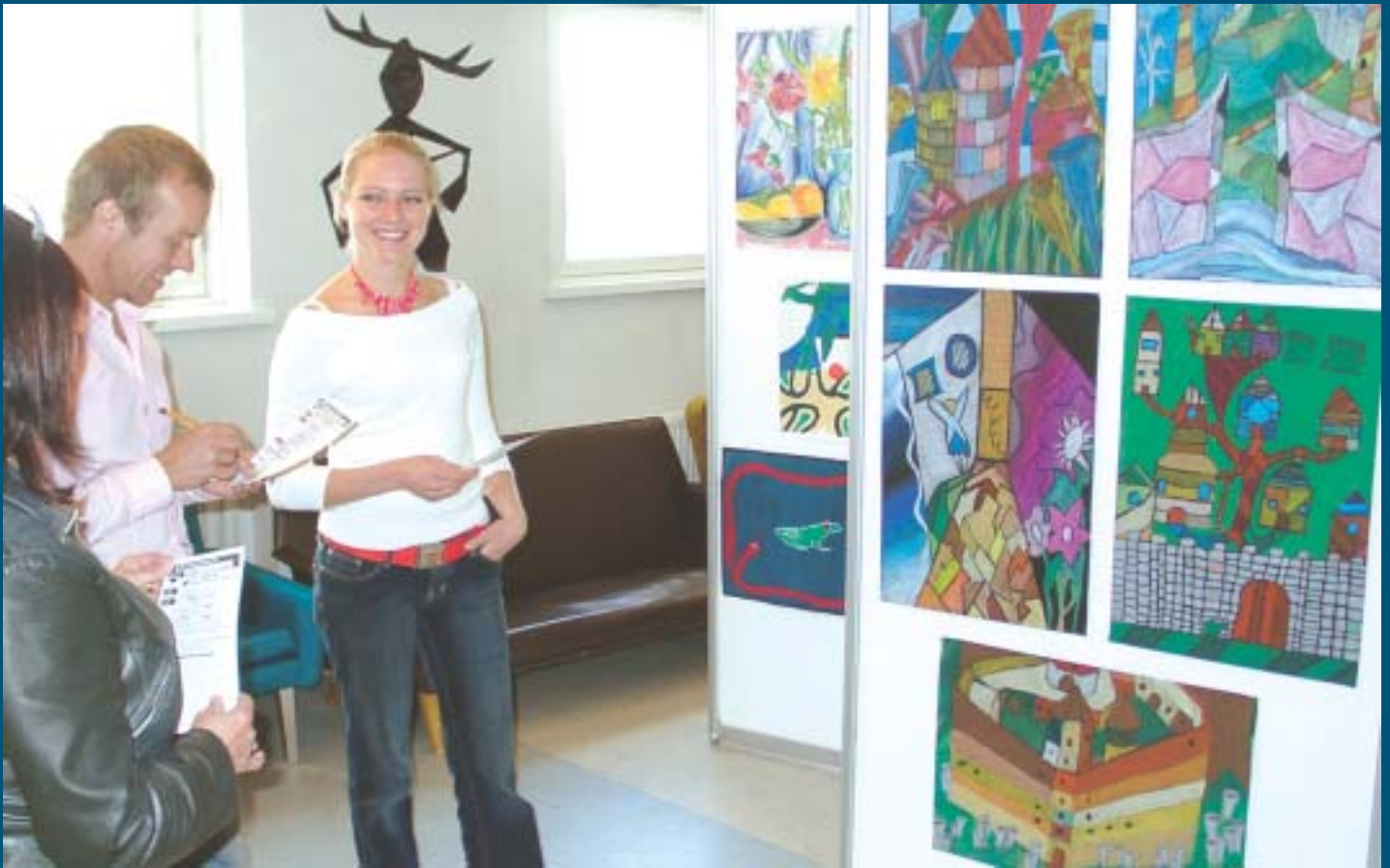
Suukin kiepsahti silleen oikein päin hauskoja ja värikkäitä töitä hämmästellessä.