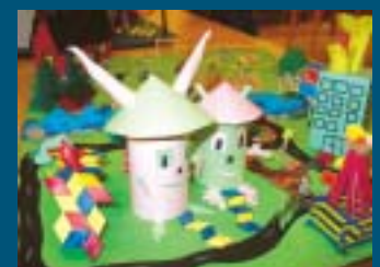
Muurolan koulun oppilasryhmien Fantasiakaupungit