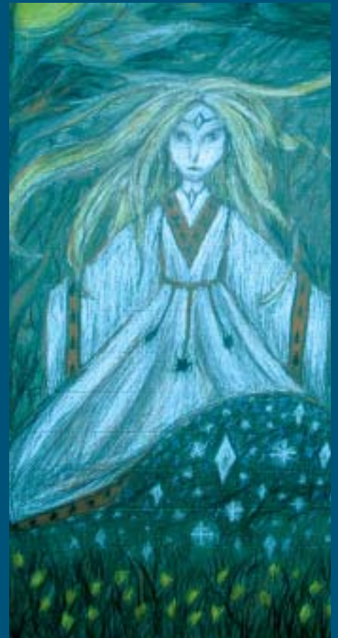
Lapin neito, Napapiirin yläaste

Wiljamin henkeenkin, eikä varmasti olisi haitaksi, jos ainakin osa töistä saisi jäädä tänne pysyvästikin esille.