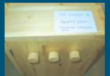
Kuksa ja kassakaappi näytteinä Napapiirin koulun veistotaidoista