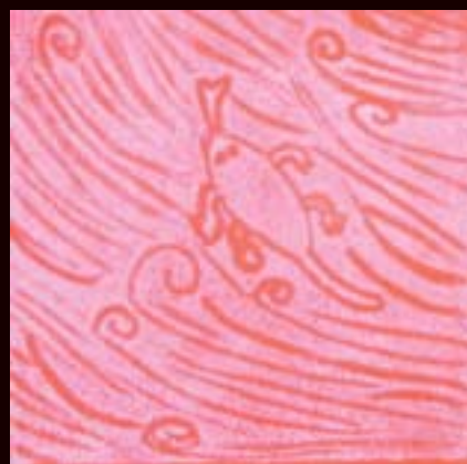
"Flying Lizard" Elmeri Vanhatalo 7.Ik