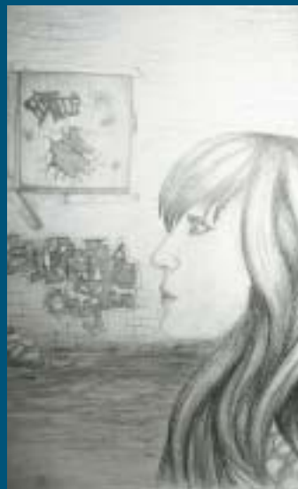
E. Aho Napapiirin yläaste