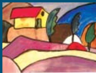
Jenna 8. Korkalovaaran yläaste