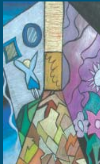
Tekijä jäi harmillisesti tuntemattomaksi. Napapiirin yläaste