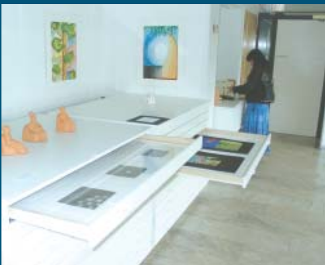
Rastikohteen kaksi oppilastyötä olivat selkeästi esillä

Kakkosrastin oppilastyöt olivat pitkäl- ti grafiikka- ja maalauspainotteisia ja teema-aiheina olivat mm. sadut, tarinat ja Lapin kansa. Hienot siveltimen vedot ja sielukkaat graafiset toteutukset antoivat tutkiville silmille yltäkyläistä nautintoa. Upeat japanilaiset kalli- grafiityöt ikkunaseinällä olivat silmiin- pistävin kohde näyttelytilaan astut-