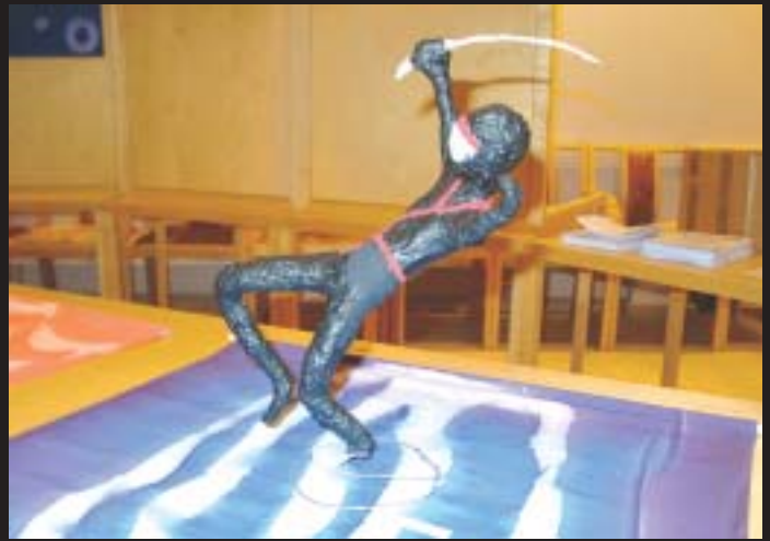
“Ninja” Niilo Kervinen 9. lk Korkalovaaran yläaste

seen mielestään kiinnostavin rasti-kohtainen oppilastyö ja tietysti napakoin perusteluin. Palautetta oppilaitten teoksista saivat kirjoitella paikalla tarjottuihin suunnistuslipukkeisiin myös muutkin rastikohteille eksyneet vierailijat.