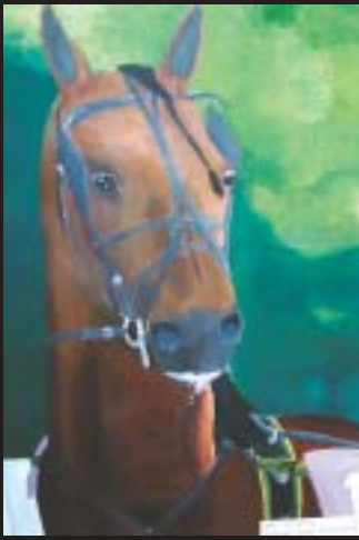
Anu Kyllönen 9. lk Rantavitikan peruskoulu