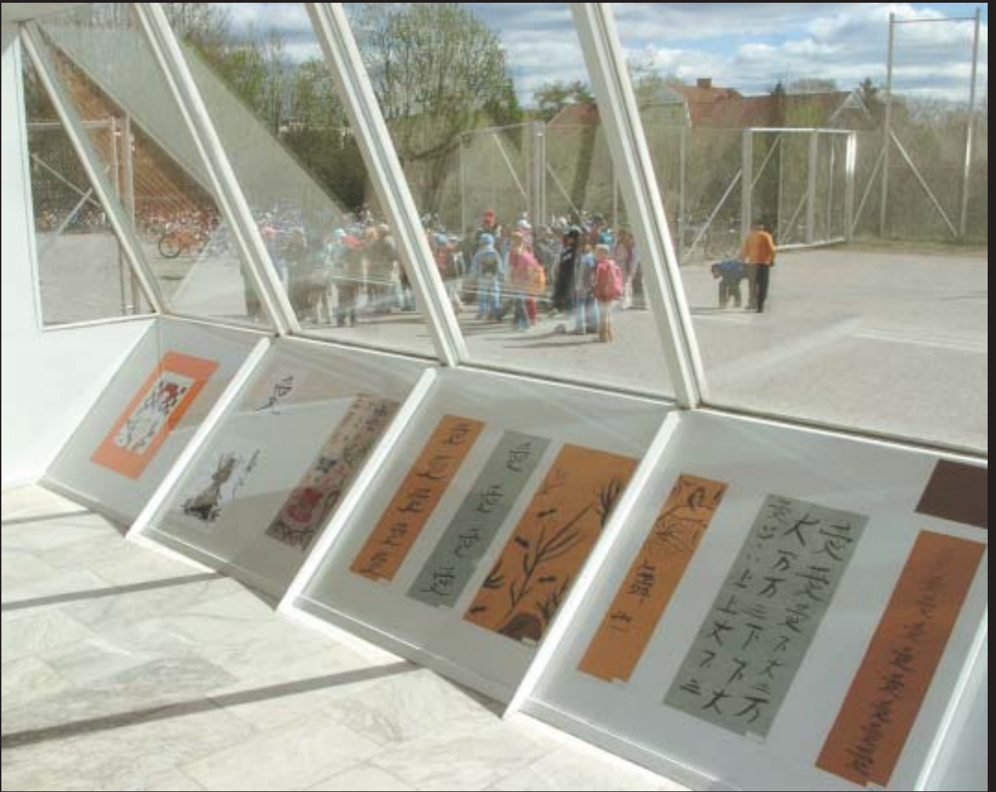
Silmää hivelevä kokonaisuus japanilaista kalligrafiaa Rantavitikan koululaisilta rastilla 2.