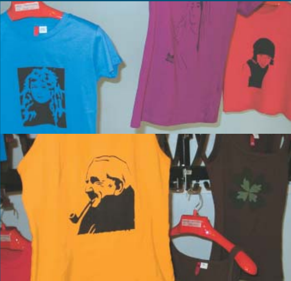
Rantavitikan peruskoulun 8. luokkalaisten räväkkä POP! Serigrafia Andy Warholin mukaan.