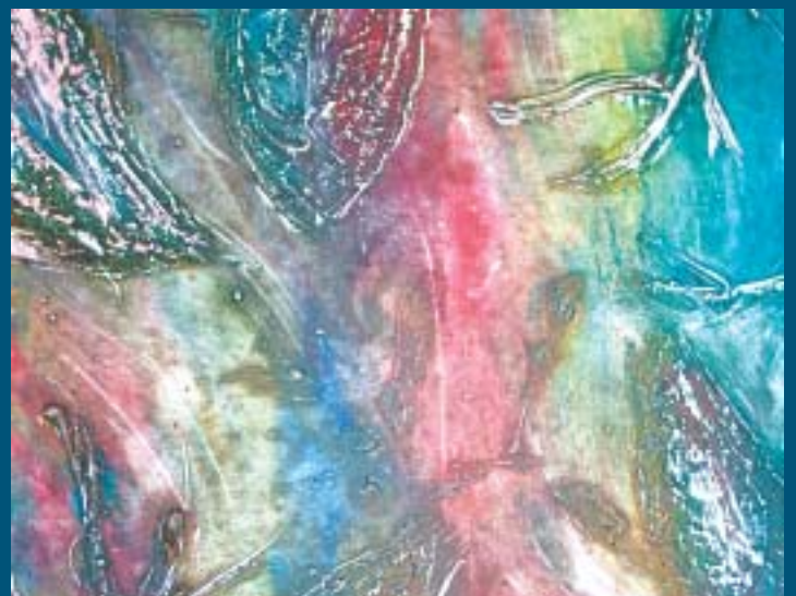
Yksityiskohta Hanna Kärkönenin laajemmasta teoksesta